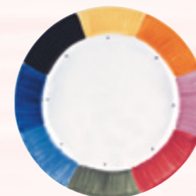
Le nuancier du faïencier