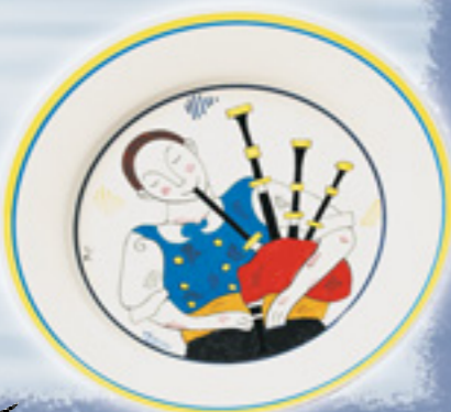
“Grand biniou” de Patrice Cudennec

à éveiller l'envie des créateurs à s'exprimer sur la faïence.