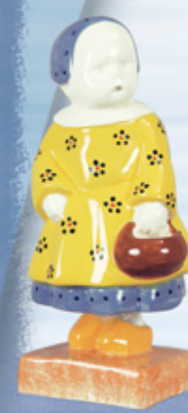
“La fillette” de Savigny