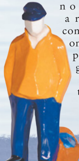
“Marin et sa godaille” de Paul Moal

Ces dernières années, de nombreux artistes contemporains ont été édités pour le plus grand plaisir des collectionneurs.